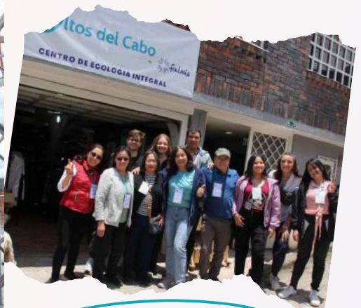
VENTA DE USADOS