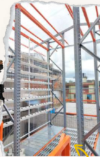
MÓDULO DE CULTIVOS HIDROPÓNICOS